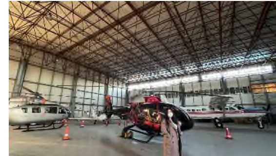
<몽골 울란바타르 구공항 격납고>