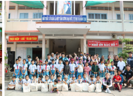
<어린이 시설 방문>