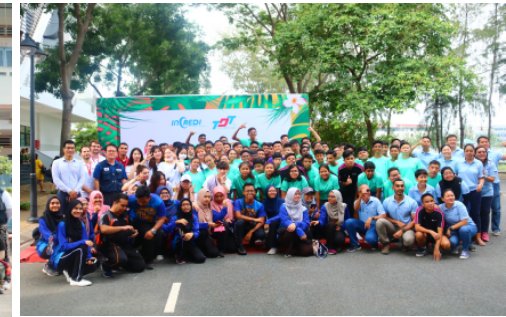
<전통문화, 체육 교류>