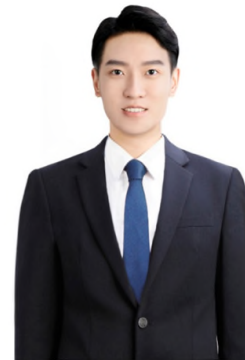
TSOTG ROLAN 극동대학교 항공운항서비스학과

“저는 극동대학교에 입학해서 선택을 잘했다고 생각합니다. 왜냐하면 본인만 열심히 공부하고 잘 따라가면 장학금도 많이 받을 수 있어 경제적으로 부담이 적고, 체계적인 교육으로 제 꿈을 한발 더 다가갈 수 있는 기회가 생기기 때문입니다.”