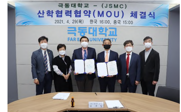
<중국 JSMC반도체와 MOU 협약식 체결>