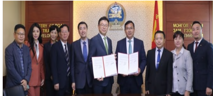
<몽골 도로교통개발부 MOU 체결>