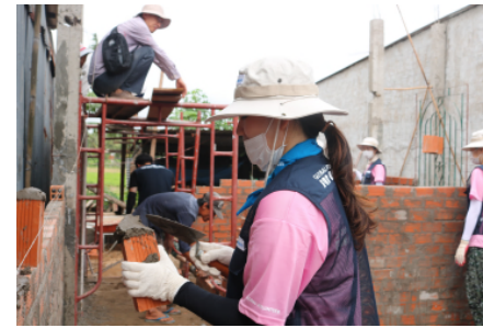
<사랑의 집 놀이터 수리 봉사>