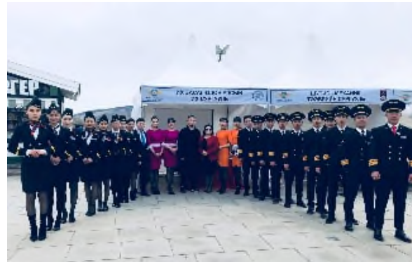
<몽골 이흐자삭대 2+2 학생들>