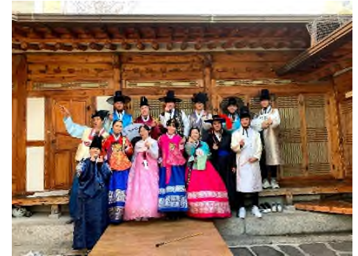
<한옥, 한복 체험>>