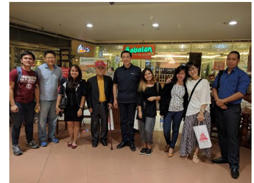
<필리핀 졸업생 마닐라 간담회>