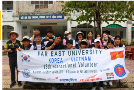
<사랑의 집 방문>