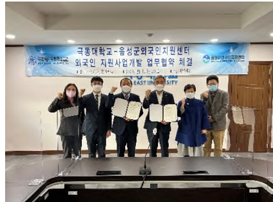
<음성군외국인지원센터 MOU 협약식>