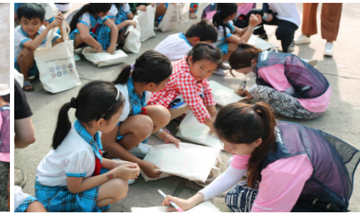
<미술치료 교실 운영>