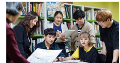
<만화애니메이션 전문가 특강>