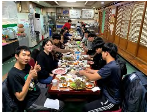
<몽골 학생 홈커밍 데이>